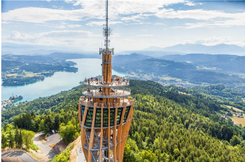
Aussichtsturm Pyramidenkogel Der Logenplatz

3. Tag: Nach dem Frühstück beginnt die Heimreise nach Gamlitz, Eibiswald, Soboth, wo wir eine Kaffeepause einlegen. Weiterfahrt nach Lavamünd, Bleiburg, St. Kassian, Klagenfurt, Velden bis zum Restaurant Karawankenblick, da nehmen wir das Mittagessen ein. Anschließend geht es zum Pyramidenkogel, wo wir auf den im Jahre 2013 neu erbauten 100m hohen Aussichtsturm mit einem Aufzug oder mit den 441 Stufen erklimmen werden. Weiter geht es dann Spital, Möllbrücke, Lienz, Felber Tauern bis zum Gasthof Brücke, wo wir zum Schluss noch eine Stärkung zu uns nehmen, bevor wir zu Hause sind.